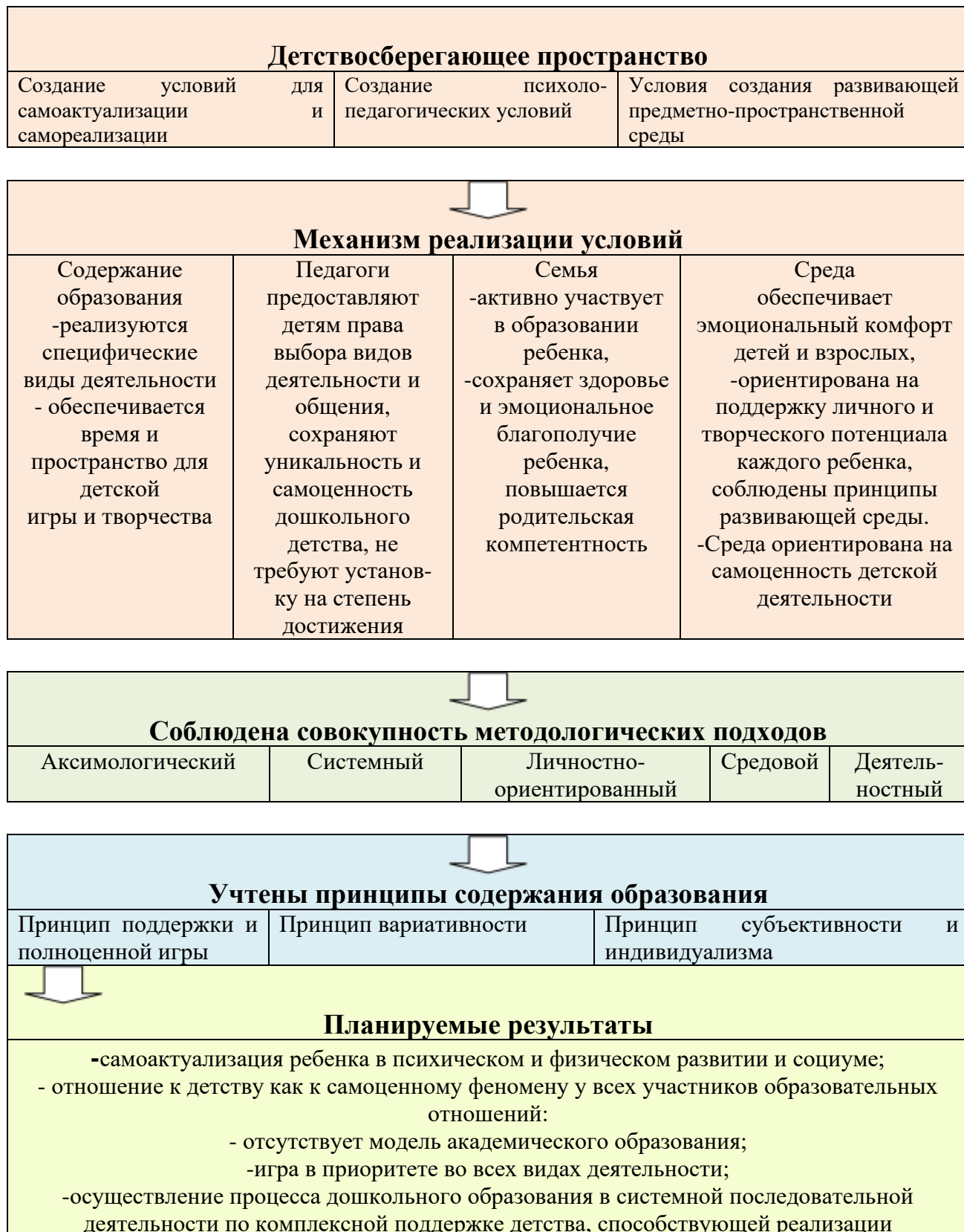
Рисунок 1. Модель детствосберегающего образовательного пространства

Модель формирования детствосберегающего пространства в образовательном учреждении представлена нами на рисунке 1.